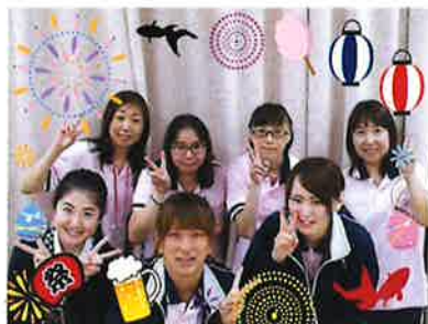
お待ちしております